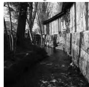
La Drize - avant