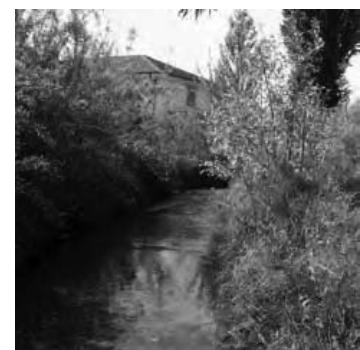
La Drize - après