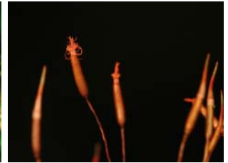
Une capsule de mousse