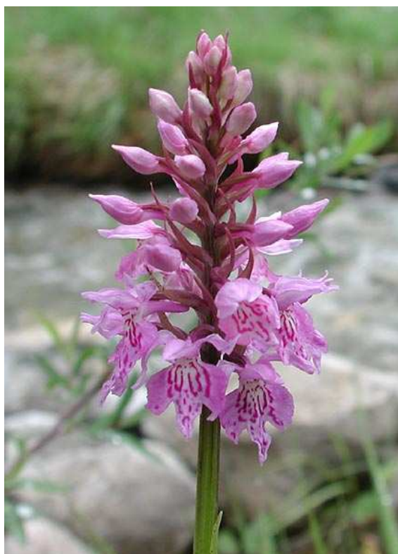
D. fuchsii ©P. Dubois, 2002, Vercors

Dans certains documents, un hybride D. x transiens (Druce) Soó a été décrit, mais de manière peu satisfaisante.