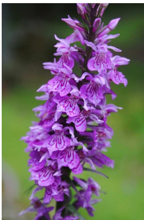
D. maculata s. str. ©D. Jeanmonod, 2011, Alpes