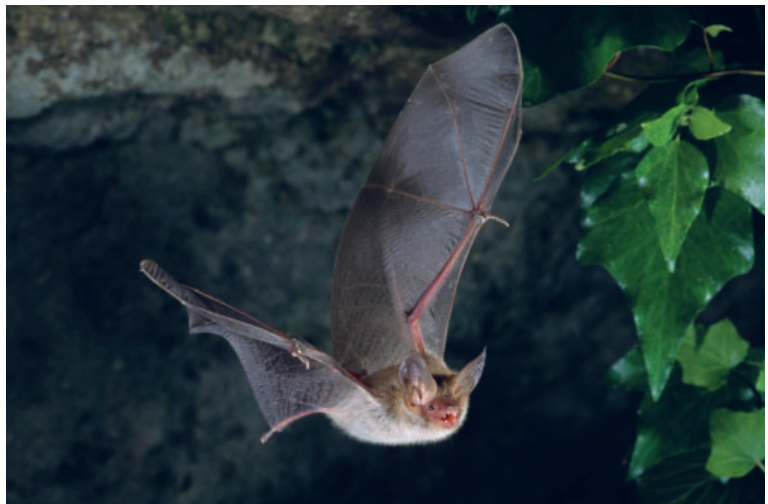
Le Murin de Bechstein ( Myotis bechsteinii ) apprécie les massifs anciens de feuillus, photo © Laurent Arthur.

Nous irons en effet à la rencontre des chauves-souris, des mammifères volants peu connus, et nous découvrirons que leur présence en forêt s'effectue par opposition à celle des hommes. Nous découvrirons leurs rythmes, leurs façons de vivre, pour tenter de mieux percevoir leur façon de vivre au monde que l'on se partage. Une question sera posée: et si l'identité des hommes était