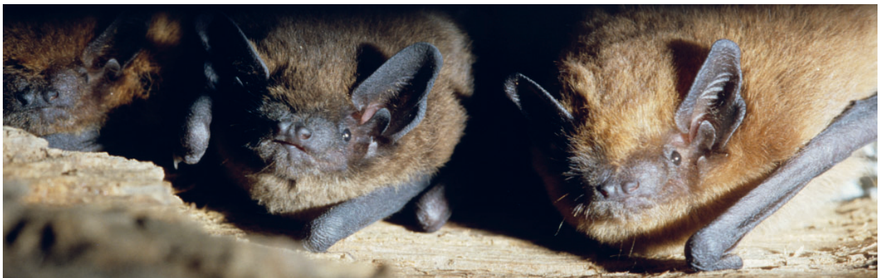
Une mère de Pipistrelle commune ( Pipistrellus pipistrellus ) et son jeune.

dépendante de celle des chauves-souris? Et si, finalement, il ne nous fallait pas changer notre façon de voir la forêt pour répondre aux diverses crises, climatiques, de l'énergie et de la biodiversité ? Nous verrons que ces chauves-souris sont peut-être une occasion, pour nous les hommes, de nous questionner sur qui nous sommes vraiment.