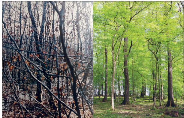
Image de la chênaie genevoise il y a 60 ans.