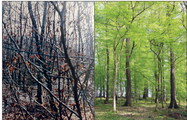
Image de la chênaie genevoise il y a 60 ans.