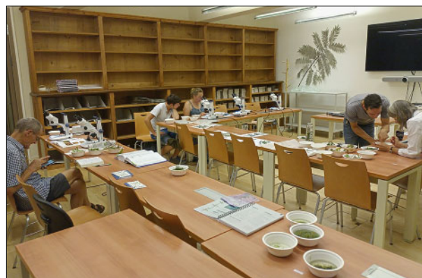
En pleine détermination.